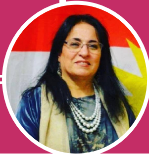
فه زیله شورش - هوله ندا

ئیک نه بونا سیسته مه کی ریکخستی په روه رده یی، کار لسهر دوست کرنا ژبیتا نیشتمانی و نه ته وهی لدهف تاکي بکه ت. دو- نه بونا په مایه کا ئیکگریتا پارت و لایه نین سیاسی و نه دانه دیار کرنا هیلین گشتی . نه فجا هر پارت هک و هکو خو