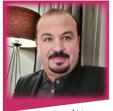
رهمه زان نصرالدين كیفلی